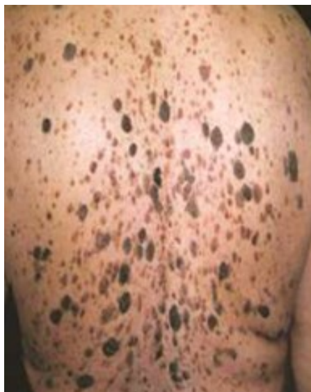
Figura 3. Queratosis seborreicas eruptivas en la piel de la espalda, patrón en “árbol de Navidad”