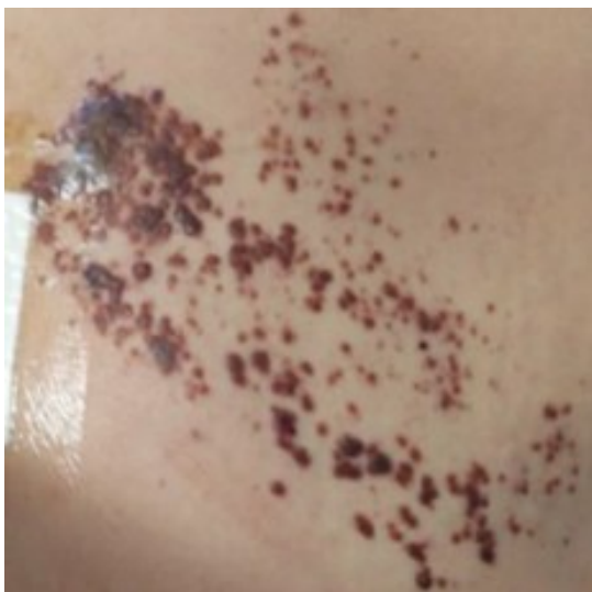
Figura 2. Características clínicas de las queratosis seborreicas.

Nota. Máculas, pápulas y placas pigmentadas bien delimitadas, de color marrón, que parecen estar “pegadas” a la piel de la espalda.