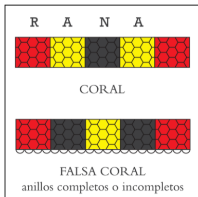
Figura 2. Diferencias entre coral real y falsa coral.