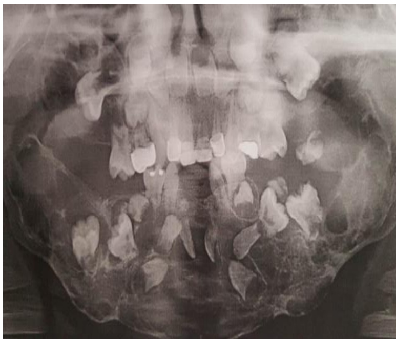
FIGURA 1. Hallazgos de radiografía panorámica del paciente