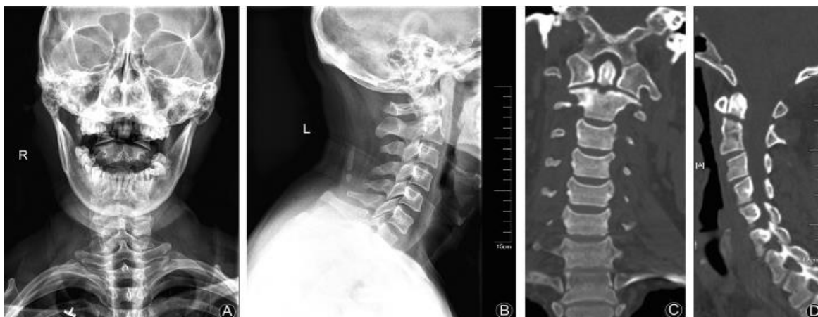
FIGURA 2. Estudios de imágenes de fractura de odontoides