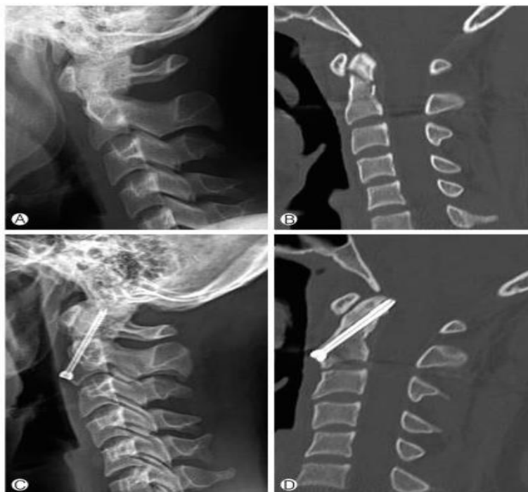
FIGURA 4. Fractura de odontoides fijada con tornillo único anterior