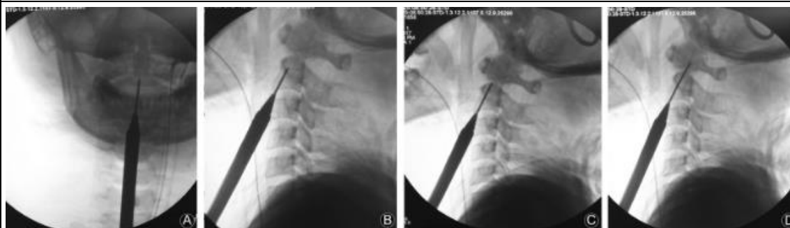
FIGURA 3. Secuencia de colocación de tornillo anterior con imágenes con fluoroscopia