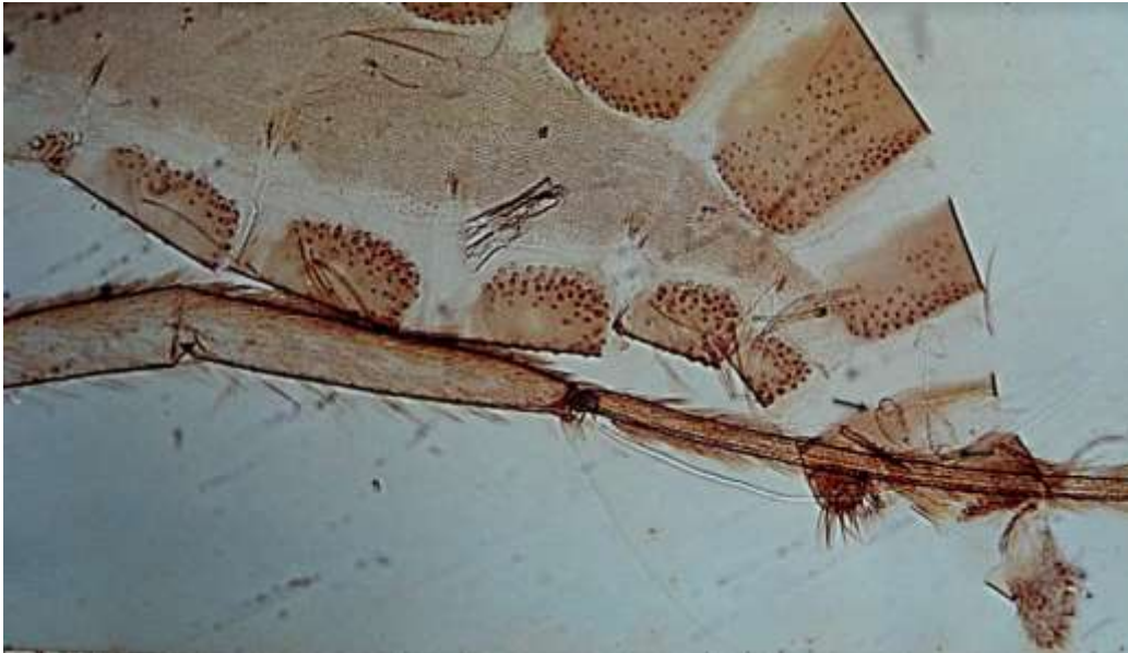
FIGURA 1. Abdomen (terminalia) de adulto hembra de Lutzomyia pastora e, Objetivo de 10X, nótese la estrangulación que separa el cuerpo de las espermatecas, del botón terminal.