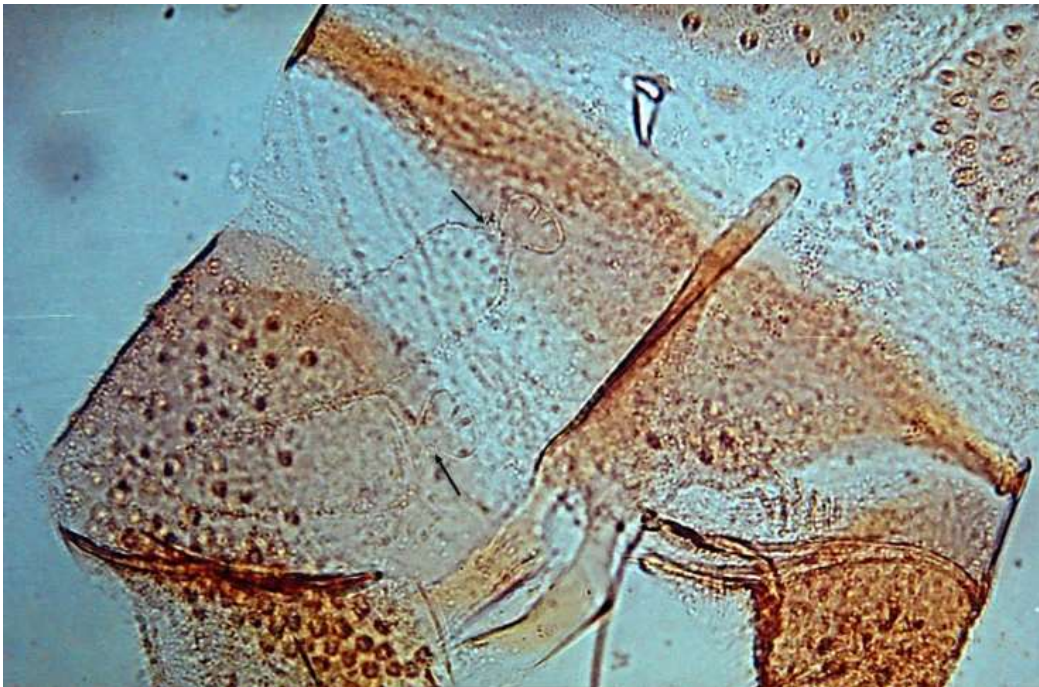
FIGURA 2. Abdomen (Terminalia) del adulto hembra de Lutzomyia pastora e, Objetivo de 40X, nótese la estrangulación que separa el cuerpo de la espermateca, del botón terminal.