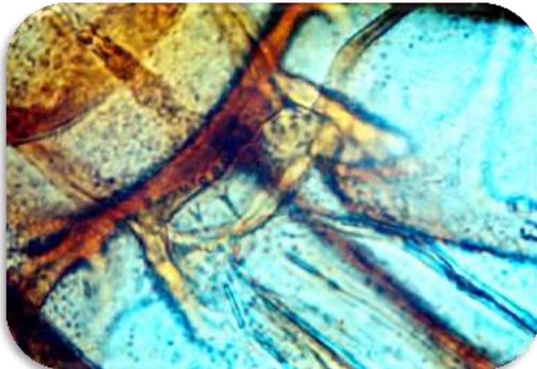
FIGURA 4. Cibario de Lutzomyia pastora