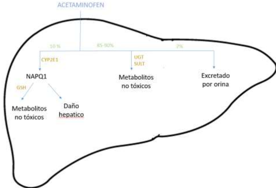
FIGURA 1: Metabolismo del acetaminofén, NAPQ1 (N-acetil-p-benzoquinoneimina) y GSH (glutati6n hepática)