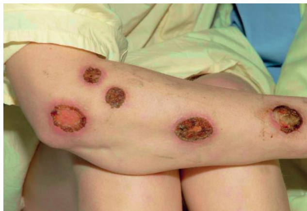
Figura 1. Lesiones nodulares con centro necrótico en antebrazo sugestivas de sífilis maligna

Fuente. Bologna JL, Schaffer JV, Cerroni L, editores. Dermatolog a. 4a ed. Elsevier; 2018.